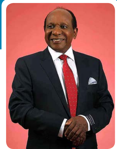
Reginald Mengi @regmengi