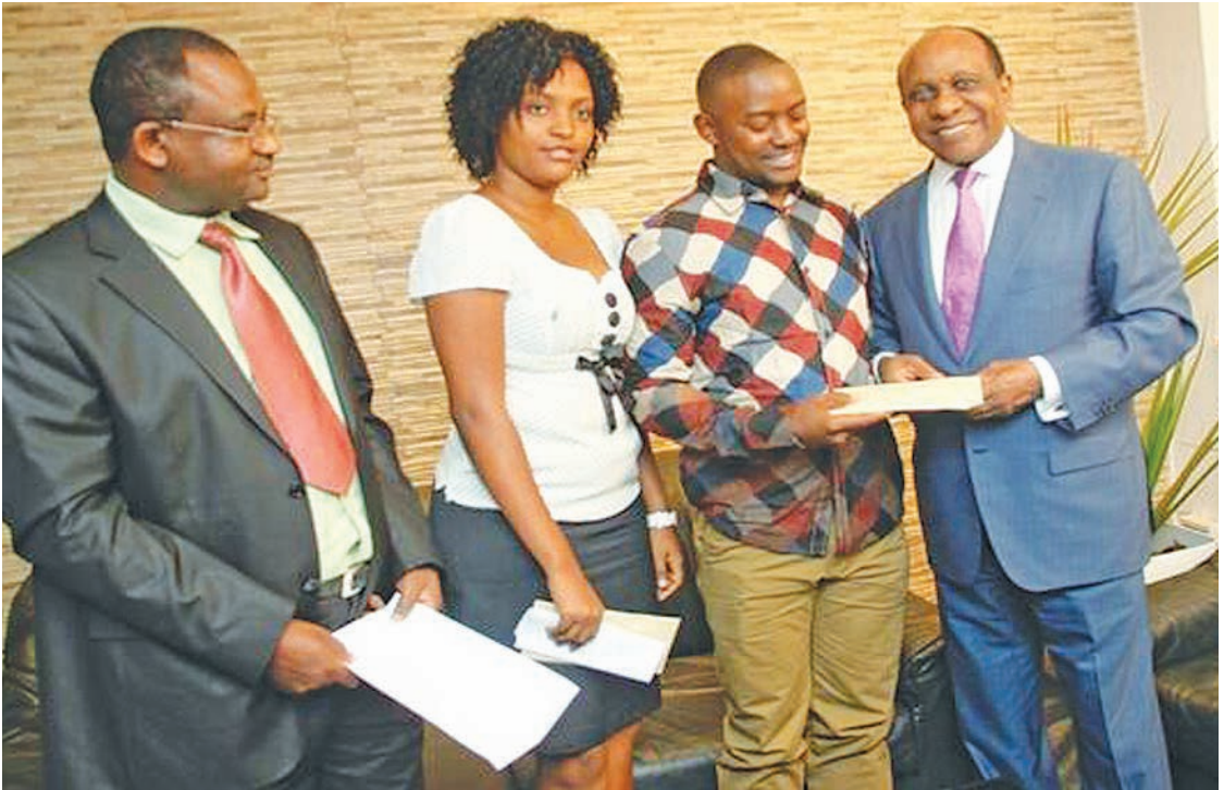
Washindi wa Mwezi Juni wakipongezwa na kupewa zawadi na Dk. Mengi.